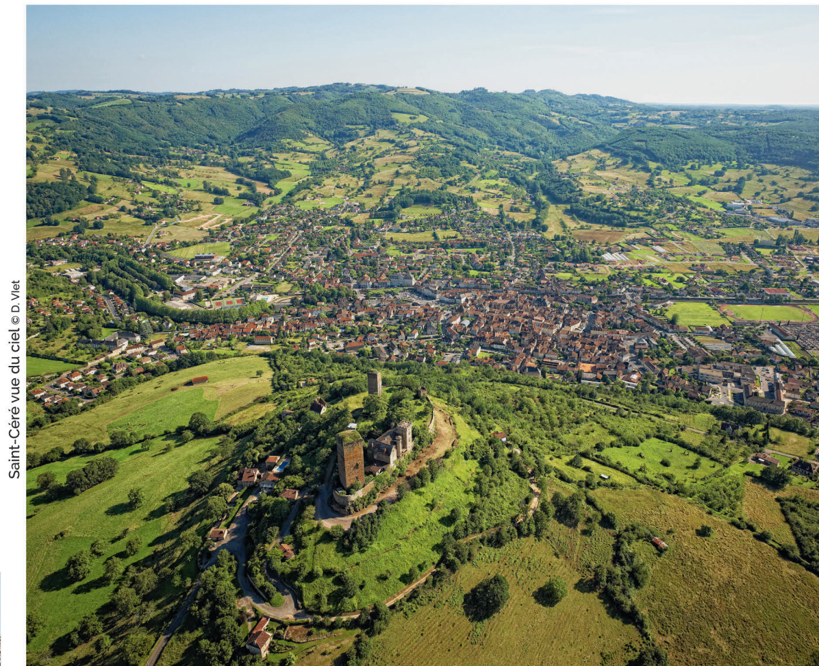
Saint-Céré vue du ciel