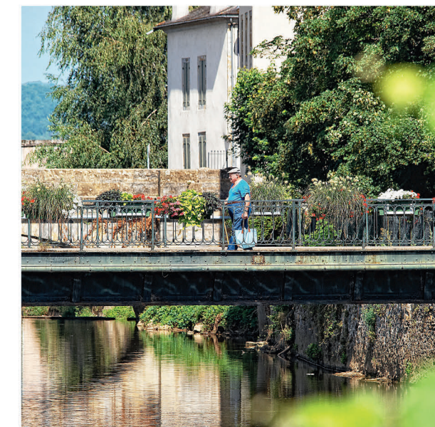
Le pont d'Hercule

Markets and fairs Fairs: every 1 st and 3 rd Wednesday of each month Markets: Every Saturday and Sunday mornings