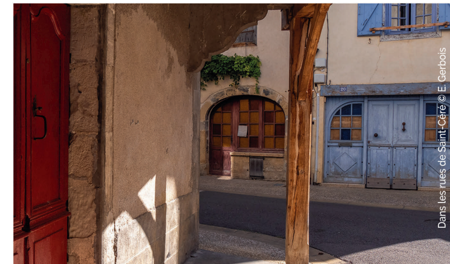
Dans les rues de Saint-Céré

In the 17 th and 18 th centuries, Saint-Céré prospered again: the ramparts were knocked down in order to build elegant town houses.