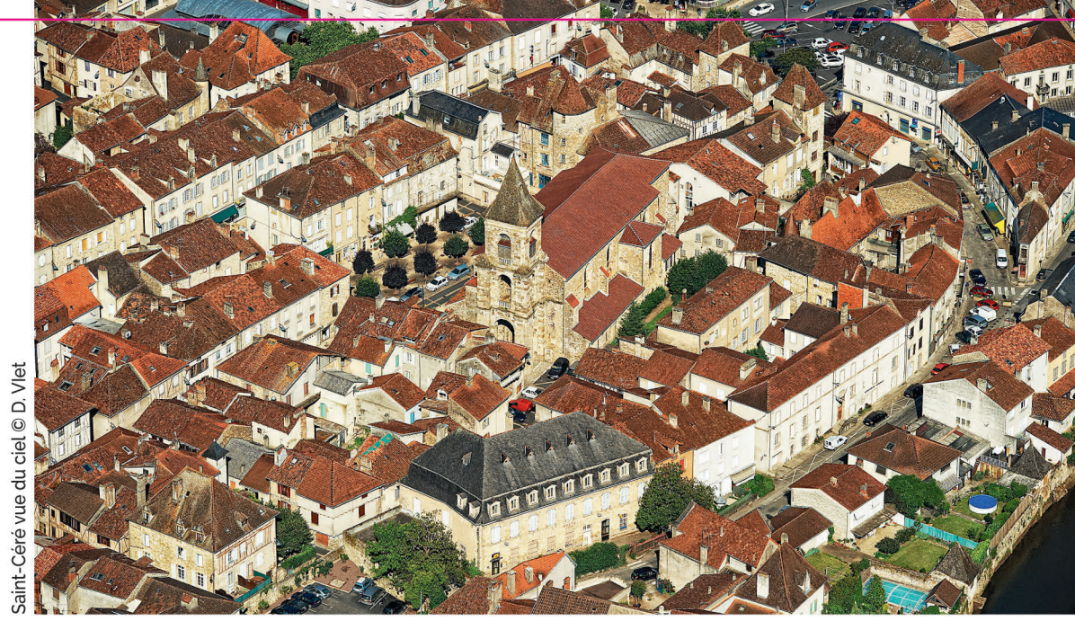
Saint-Céré vue du ciel

Au XIX e siècle, Saint-Céré continua son essor commercial et artisanal. Aujourd'hui, le centre ville reflète l'image d'un grand dynamisme avec plus de 100 commerces diversifiés qui, au travers de leur association, propose régulièrement des animations. Saint-Céré est aussi au cœur d'un territoire de projets qui s'identifie et s'affirme autour de savoir-faire liés aux métiers de l'industrie mécanique, en particulier dans les domaines de l'aéronautique, de l'automobile et de la machine outil : La Mécanic Vallée.