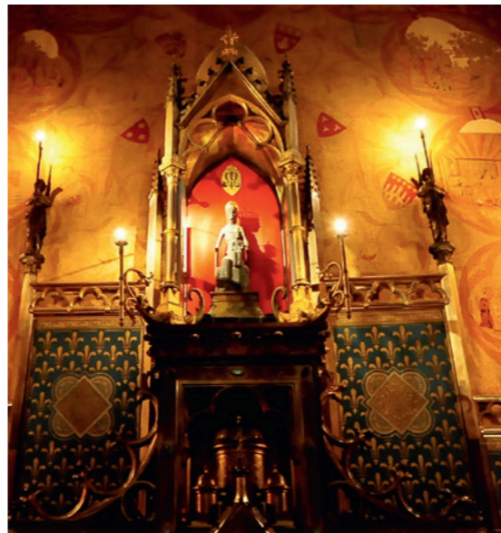
La Vierge Noire

pellegrini. La cappella miracolosa, una delle 7 altre cappelle costruite nella roccia, ospita un gioiello: la Vergine Nera venerata da oltre un millennio. Nella via principale che attraversa il paese si affiancano le antiche porte fortificate e gli antichi chioschi (ora trasformati in negozi e ristoranti), belle case medievali e poi il municipio con le sue finestre bifore... sembra che il tempo si sia fermato a Rocamadour.