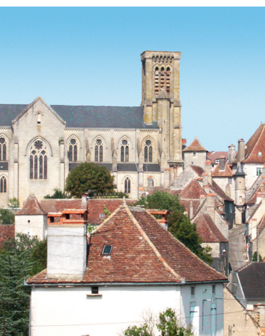
Eglise St-Pierre