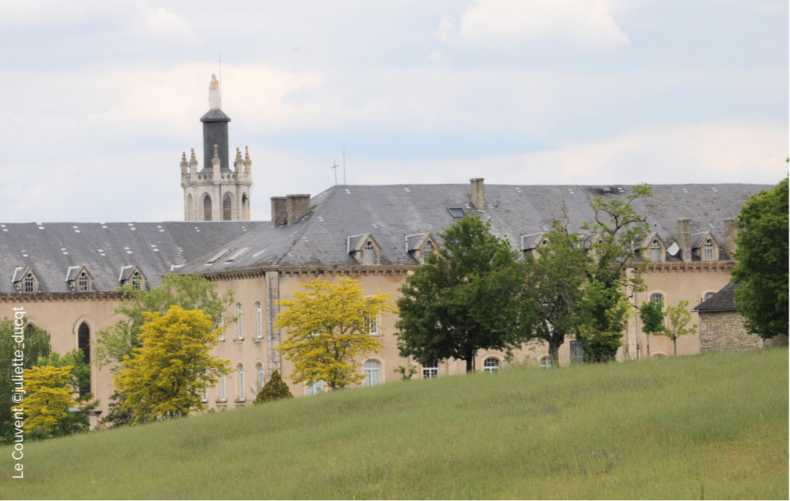
Le Couvent

de Cahors. En 1790, Gramat comptait 1346 habitants.