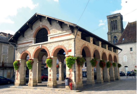
La Halle © L2SH

The Hundred Years' War, followed by the plunders and the plague of 1348, almost entirely destroyed Gramat. Only five families survived. The city was then repopulated by immigrants from neighbouring regions such as Auvergne, Rouergue and Limousin. 5km from Gramat, the church Saint-Aignan in the hamlet of Saint-Chignes was part of a priory destroyed during the Hundred Years' War. It was later rebuilt to become the parish church. Its various periods of construction and modification spread from the Romanesque era to modern times. Thanks to the aid of the municipality and a local association its roof was restored in 2017. Its 19th century ornamental heritage will also be restored in the near future. During the Religious wars, Gramat was successively occupied by Catholics and Protestants. The Baron de Gramat helped Henri de Navarre, future king Henri IV, to cross the