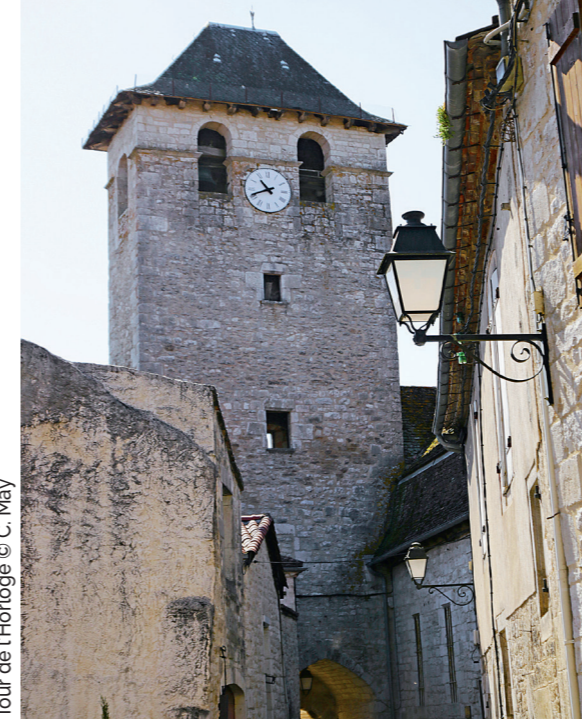
Tour de l'Horloge