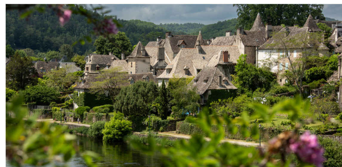
Les Quais d'Argentat-sur-Dordogne

NL Door de ligging van het stadje aan de oevers van de Dordogne ontwikkelt het zich vooral door havenactiviteiten. In de jaren '50 werden er stroomopwaarts 5 dammen gebouwd om de streek van elektriciteit te voorzien. De charme van vroeger zien we nog op de kades met haar kasseien en de oude vissers- en handelshuizen met hun houten balkons en leien daken.