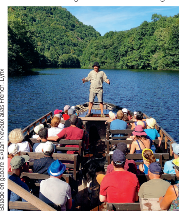
Balade en gabare

Revivez l'épopée des gabarriers le temps d'une balade en gabare . Ces bateaux traditionnels à fond plat transportaient le bois dans la région bordelaise pour la fabrication des tonneaux et piquets de vignes. Balades commentées sur l'histoire des gabares ou thématiques. Embarcadère à 10 min d'Argentat (route des Barrages). Circulation d'avril à octobre - renseignements et