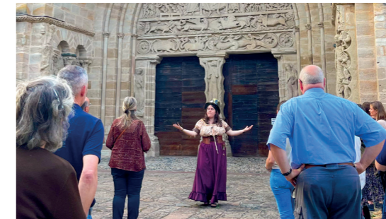
Visite théâtralisée de Beaulieu-sur-Dordogne