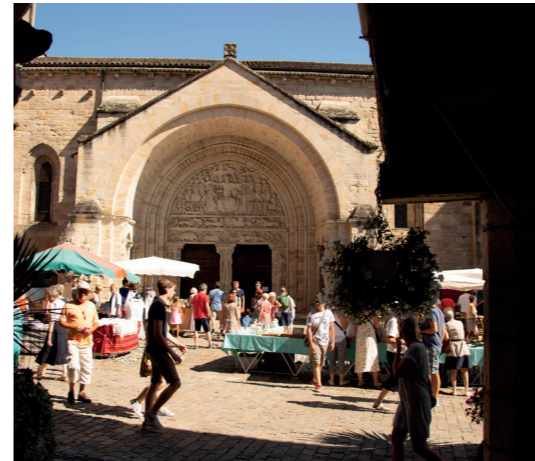
Brocante de Beaulieu-sur-Dordogne