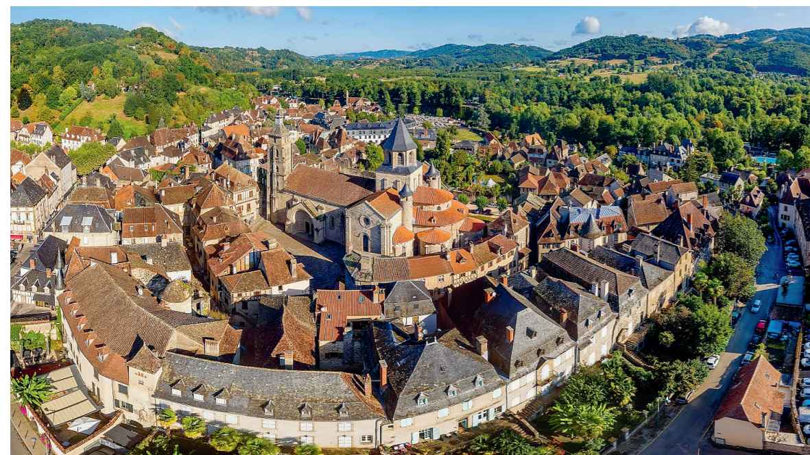
Cité médiévale de Beaulieu-sur-Dordogne

Daarom wordt Beaulieu ook wel de Riviera van de Limousin genoemd. Aan het einde van de rue de la Chapelle, aan de oever van de Dordogne, bevindt zich de pelgrimskapel.