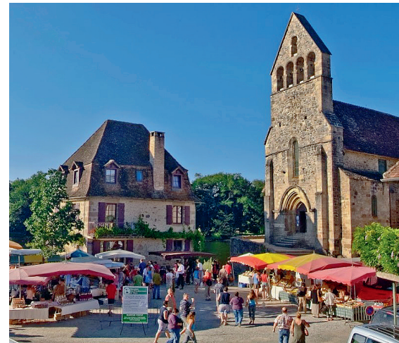
Marché de producteurs de pays à Beaulieu