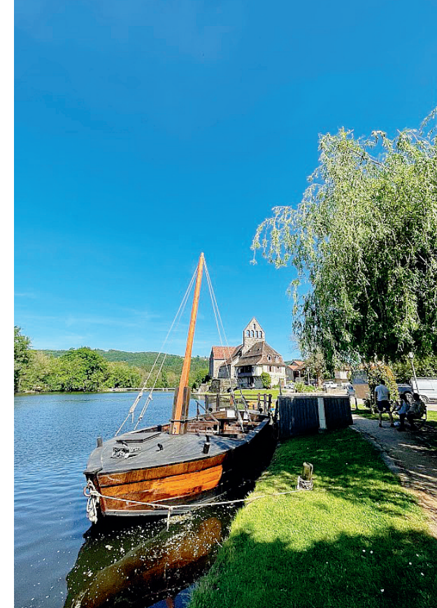
Les quais de Beaulieu-sur-Dordogne

Begeleide wandelingen met commentaar in juli en Augustus. Reserveren ophet toeristenbureau