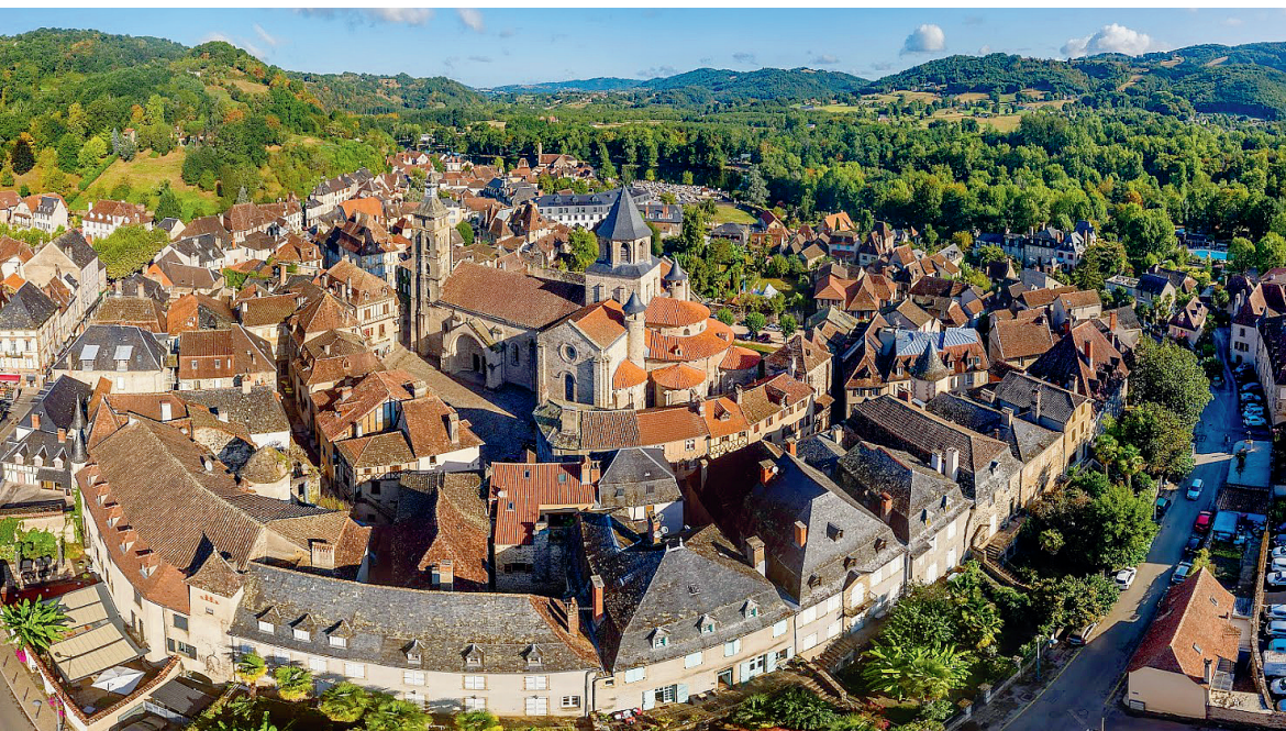
Cité médiévale de Beaulieu-sur-Dordogne © Christophe Bouthé - Agence Vent d'Autan - Vallée de la Dordogne

Bellus Locus vanwege zijn schoonheid. Het klooster zal van 1095 tot 1213 tot de succesvolle orde van Cluny behoren. Het doorstaat de Honderdjarige oorlog maar heeft daarentegen veel te lijden tijdens de godsdienstoorlogen.